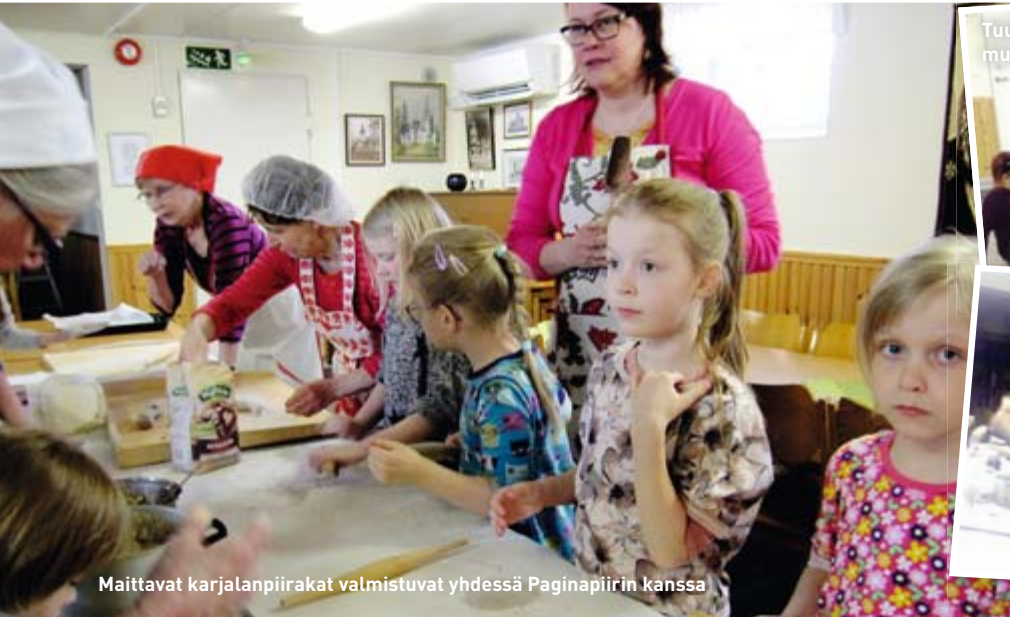
Maittavat karjalanpiirakat valmistuvat yhdessä Paginapiirin kanssa