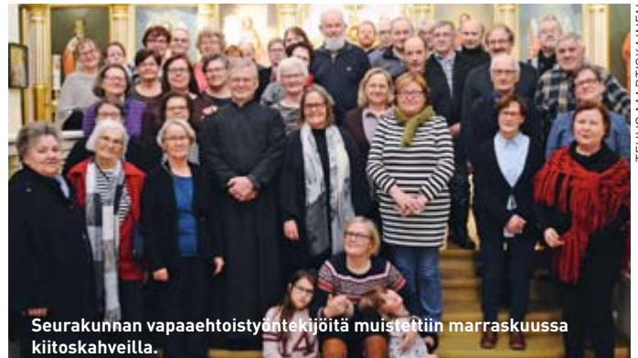
Seurakunnan vapaaehtoistyöntekijöitä muistettiin marraskuussa kiitoskahveilla.

Tapahtumalla on säävaraus. Seuraa ilmoittelua seurakunnan netisivuilla ja Pogostan Sanomissa.