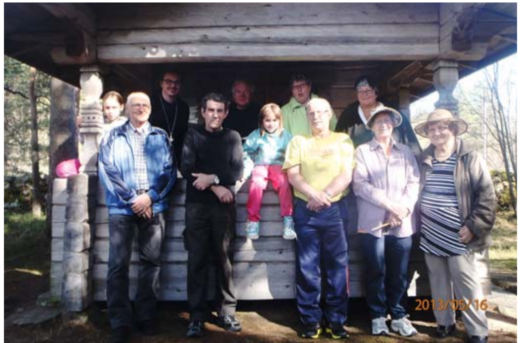
Pyötikön tsasounan siivoustalkoolaisia muutaman vuoden takaa.