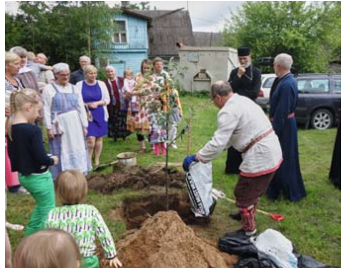
Liturgia Obinitsassa, kirkon 60-vuotisjuhla ja ystävyiden omenapuun istutus oli matkan kohokohta. Isäntämme kantoivat bussiimme vielä laatikkokaupalla eväitä kotimatkalle. Setumaalta jäi eväitä elämämme pitkäksi aikaa - ja syvä kiitollisuus sydämeen.