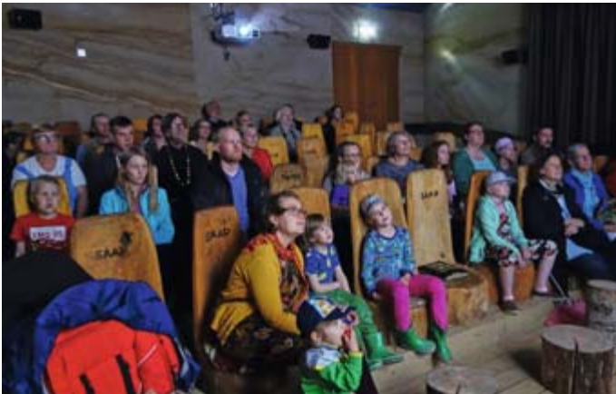
Lieniköhän lasten lempipaikka kuitenkin Piusan hiekkakivikaivos, jossa hämmäntävän lepakkodokumentin jälkeen päästiin lopulta asiaan, eli hienon hiekan kimppuun. Paras hiekkalaatikko ikinä!