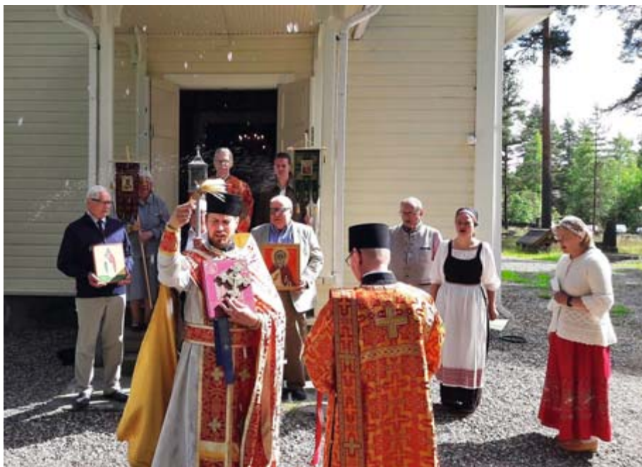
Iljan praasniekan ristisaatto.