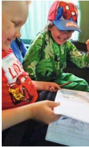
Erikoismaininta matkan onnistumisesta kuuluu lapsille, jotka jaksivat pitkätkin päivät, ohjelmat ja ajot, ihmeen reippaalla mielellä. Uusia kavereitakin löytyi!