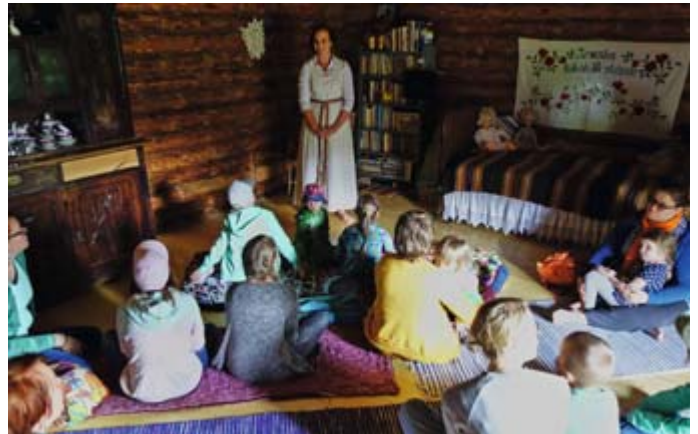
Terje kertoili piha-aitassaan muinaiskertomuksia setukielellä, joka erikoista kyllä on vironkieltä helpompi ymmärtää. Lapsia naurattivat tarinat kostonhimoisesta hämähäkistä ja niskuroivista pavuista.

kivikaivos, lasten silmin ehkä maailman suurin hiekkalaatikko. Sekä tietenkin autolautan taikuri taipuisine ilmapalloineen.