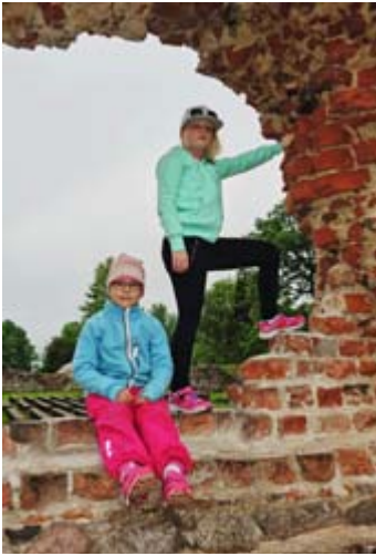
1200-luvulla tulivat Viljandiin ristiritarit, heidän mukanaan liki 700 vuotta kestänyt saksalaisten kartanonherrojen valta-aika, sekä luonnonuskonnon syrjäytännyt kristinusko. Raunioilla saa mielenkiintoinen laukata ritariratsujen jäljissä.