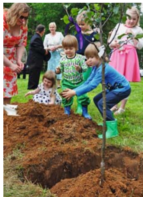
jatkuu seuraavalla sivulla

ihmeellisen reippaiksi, sopuisiksi ja joustaviksi matkaajiksi. Ohjelmassa oli mielenkiintoista nähtävää kaikenikäisille. Lasten mieleen jäivät erityisesti mielikuvitusta kiehtovat ristiritarien linnan rauniot 800 vuotta vanhassa Viljandin kaupungissa, Pölvän elämysellinen maantiemuseo, Obinitsan isäntien järjestämä toiminnallinen päivä setuperinteisiin tutustuen, sekä Piusan hiekka-